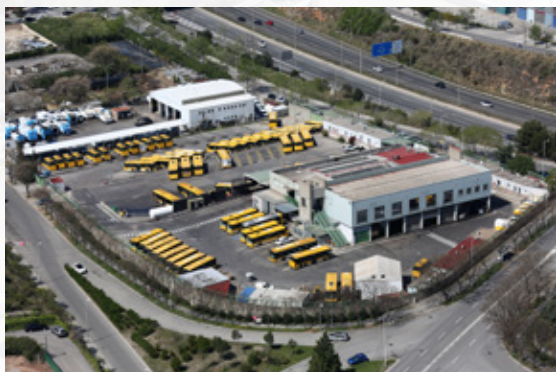
Camí de Can Ruti, s/n. 08916 Badalona